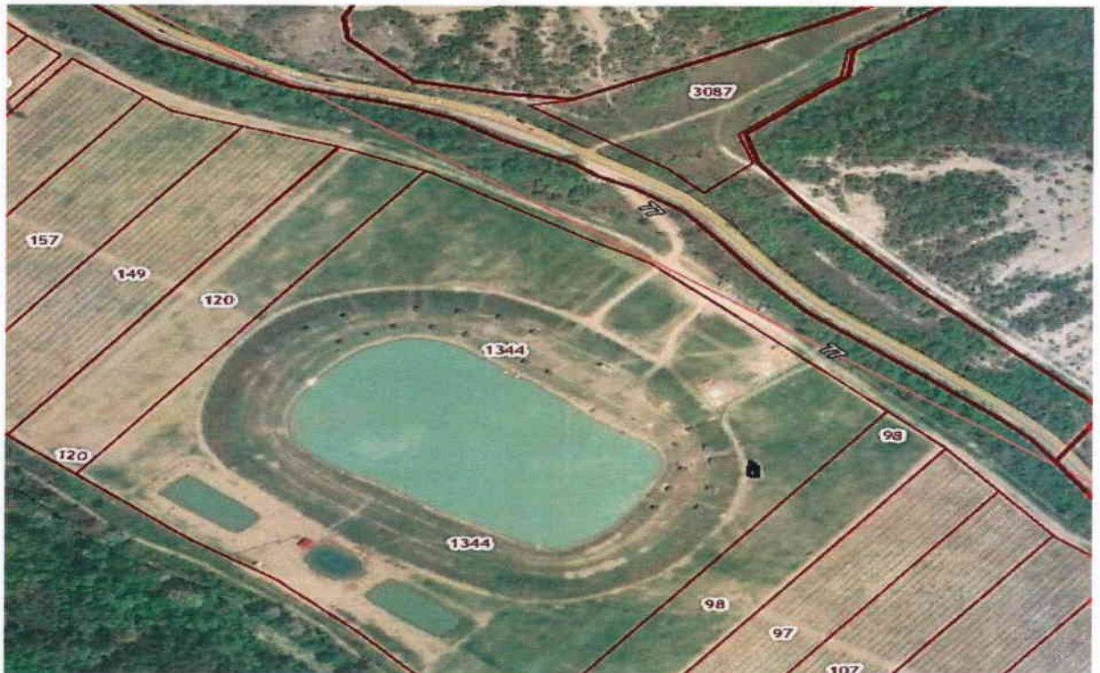
Схема дислокации контейнерной площадки за пределами населенного пункта, между с. Малое Садовое и с. Танковое на один мусорный бак